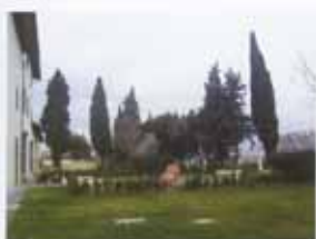
1. Il giardino della villa